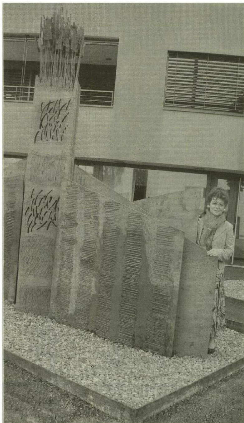
Skulptur aus Eisen von der Künstlerin Sibylle Schindler.